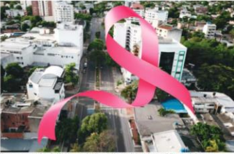
El 19 de octubre se conmemora el Día Internacional del Cáncer de Mama, una fecha que busca sensibilizar y concienciar a familias, amigas y amigas.

DIARIO LATOMA, PRIMER PLANO El 19 de octubre se conmemora el Día Internacional del Cáncer de Mama, una fecha que busca sensibilizar y concienciar a familias, amigas y amigas. En Huila, gracias a un diagnóstico oportuno, una mujer se siente mejor y más saludable.